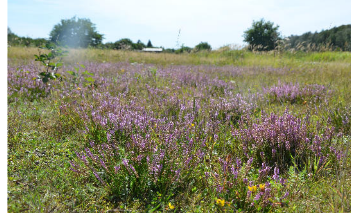
Heideblüte im Friesheimer Busch

Kostenfrei, Anmeldung erbeten. Bitte wetterfeste Kleidung mitbringen.