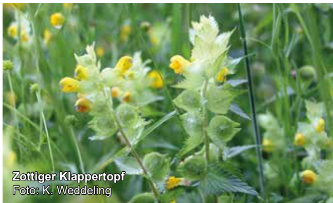
Zottiger Klappertopf