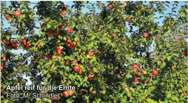
Äpfel reif für die Ernte