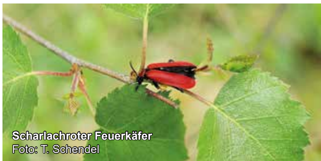
Scharlachroter Feuerkäfer