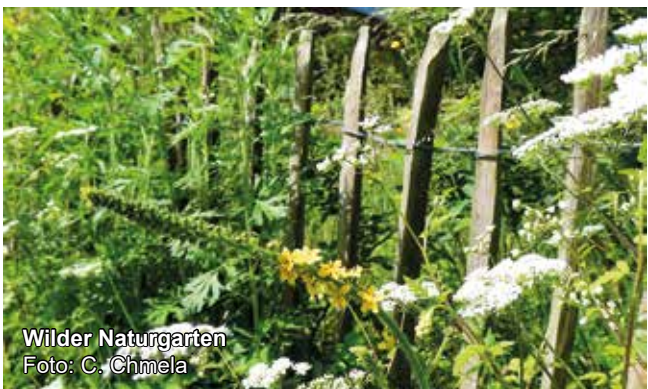
Wilder Naturgarten