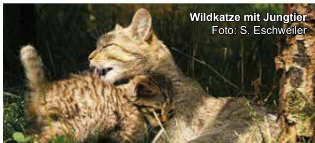
Wildkatze mit Jungtier