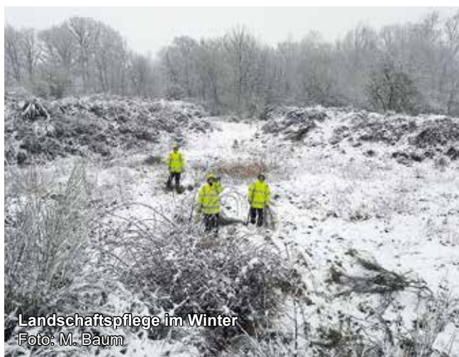
Landschaftspflege im Winter