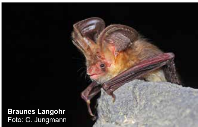
Braunes Langohr