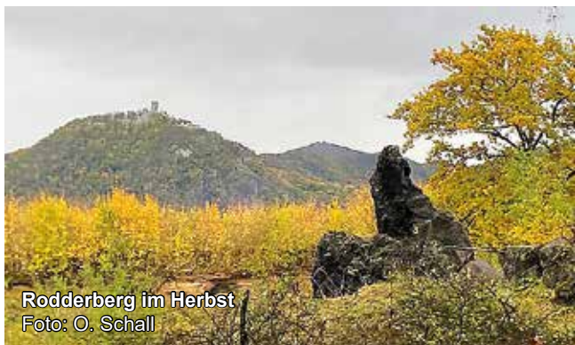
Rodderberg im Herbst

Biologische Station Bonn / Rhein-Erft e.V.