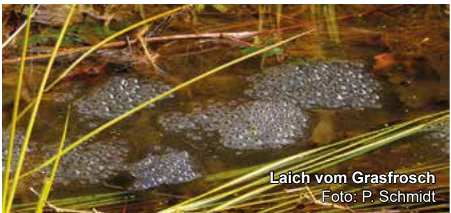
Laich vom Grasfrosch