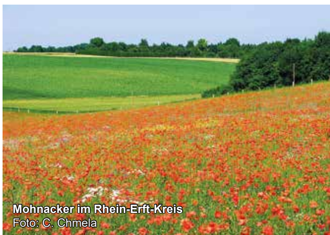
Mohnacker im Rhein-Erft-Kreis

Kostenfrei. Anmeldung erforderlich unter www.biostation-bonn-rheinerft.de/events