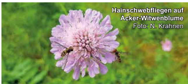
Hainschwebfliegen auf Acker-Witwenblume Foto: N. Krahen

Biologische Station Bonn / Rhein-Erft e.V.